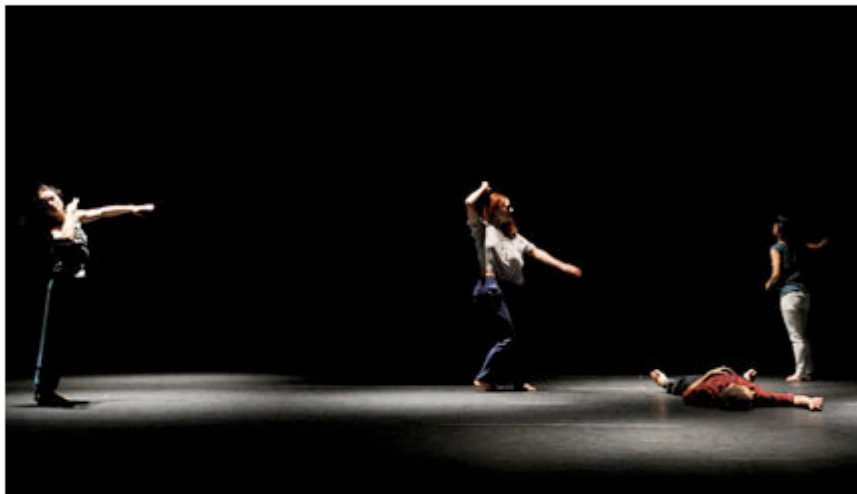
A new contemporary performance named Your Ghost Is Not Enough by the French dance group Kubilai Khan Investigations will be staged at IDECAF next Friday, September 26, in HCM City.

HCM CITY - A new contemporary performance named Your Ghost Is Not Enough by the French dance group Kubilai Khan Investigations will be staged at IDECAF (Institut D'Echanges Culturels Avec La France) next Friday, September 26, in HCM City.